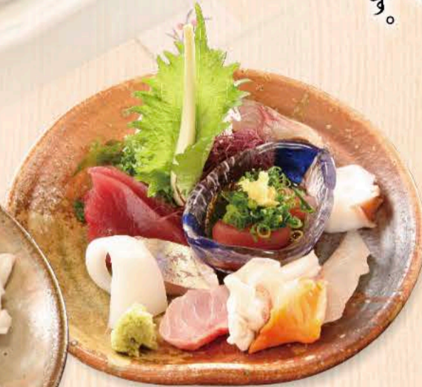
刺身の盛り合わせ (一人前) 1,650円～