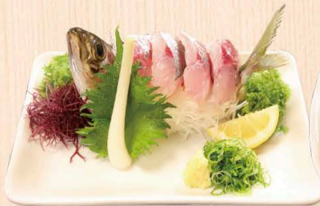
由比の地あじの刺身 880円～