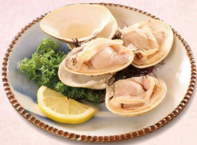
はまぐり 1,350円～ 焼いても酒蒸しでも身が縮まない 大粒の地ハマグリ