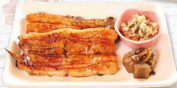
鰻の蒲焼 2,970円 王道ですね