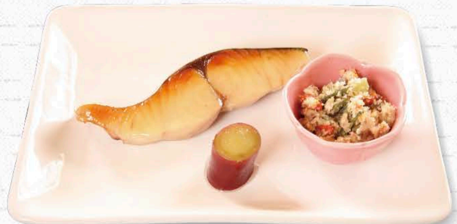
さわらの西京焼き 1,320円 西京みその香りがほんのり