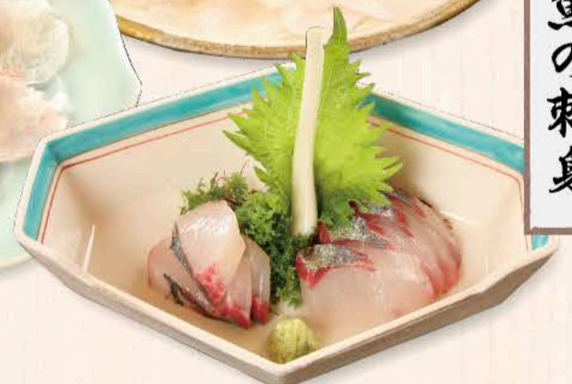
しまあじの刺身 (春～夏) 1,320円～