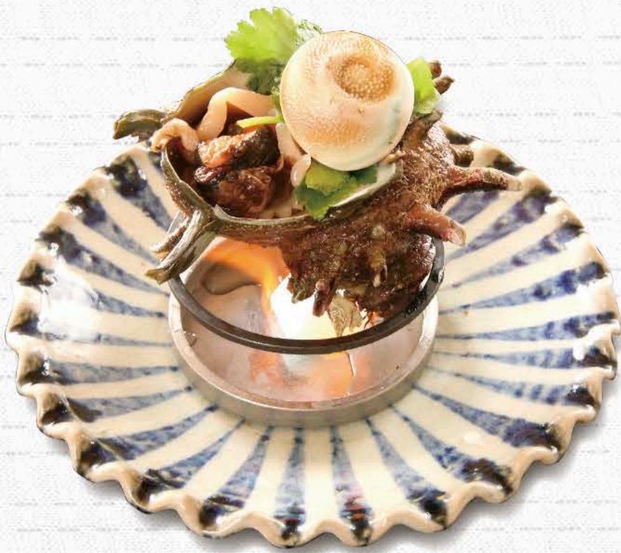
さざえのつぼ焼き 1,700円~