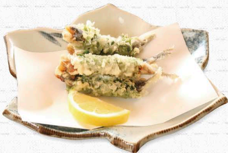
いわしの梅肉揚げ 1,100円