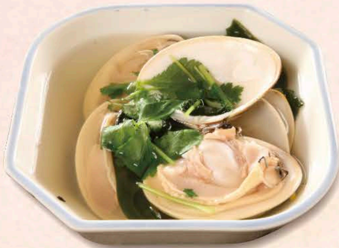
はまぐりの酒蒸し 1,350円～