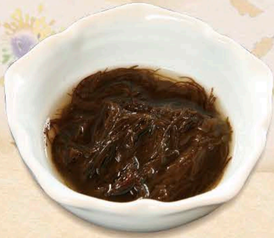
もずくの酢の物 660円