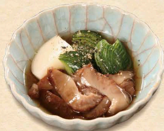
なまこの酢の物 660円