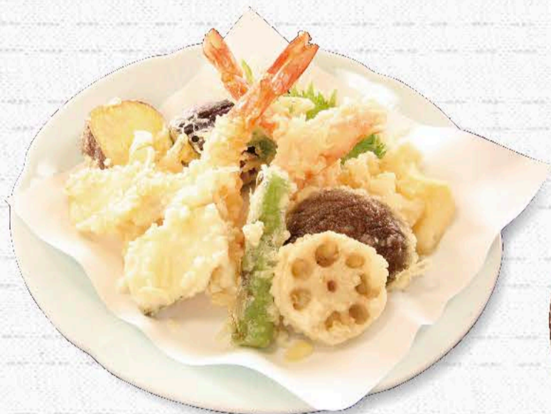
天ぷらの盛り合わせ 1,320円 10種類の具たくさん