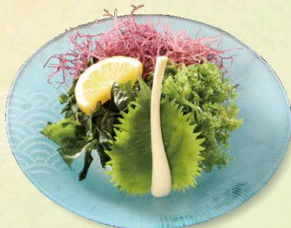
とってもヘルシー 海藻サラダ 770円