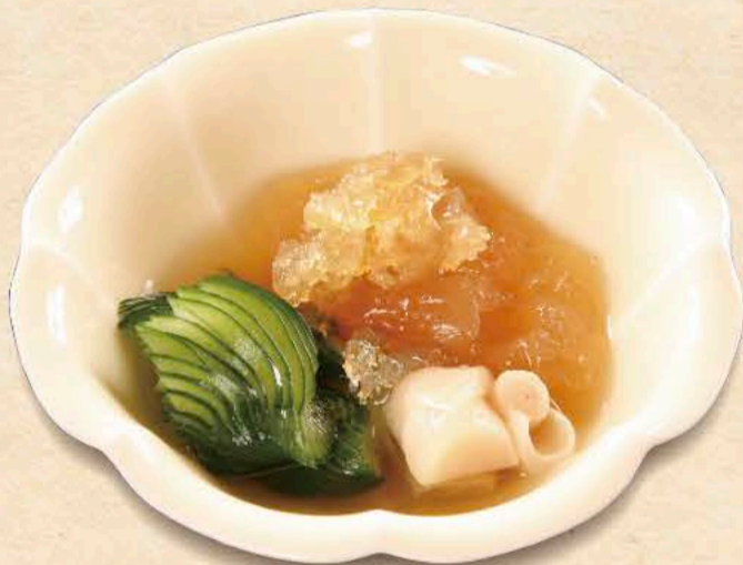
くらげの酢の物 660円