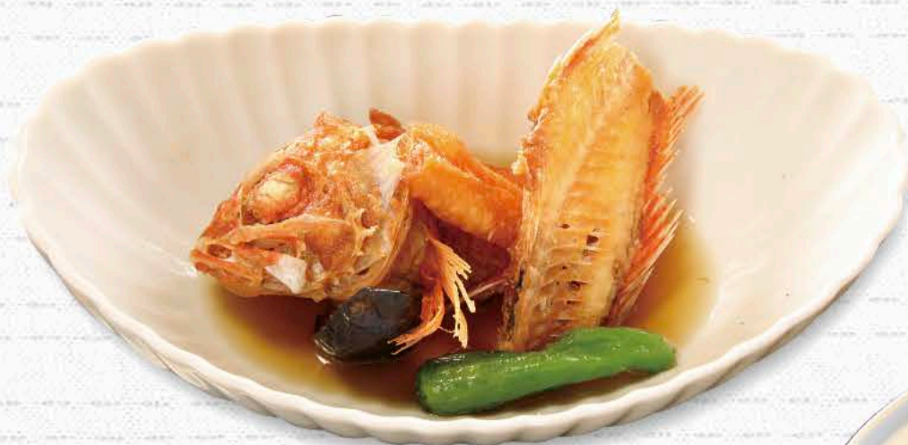
かさごの揚げだし 880円 花ぜんのロングセラー。頭からしっぽまでサクサクです