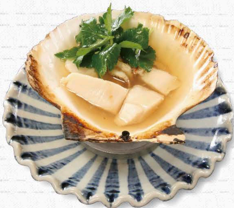
ほたての醤油焼 880円