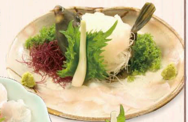
→ かわはぎの刺身 (秋～春) 1,980円～