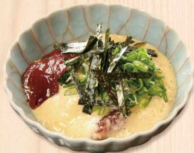
まぐろの山かけ 1,100円