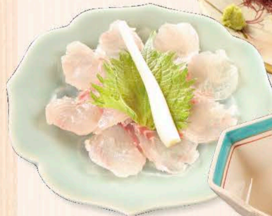
いさきの刺身 (春～夏) 1,320円