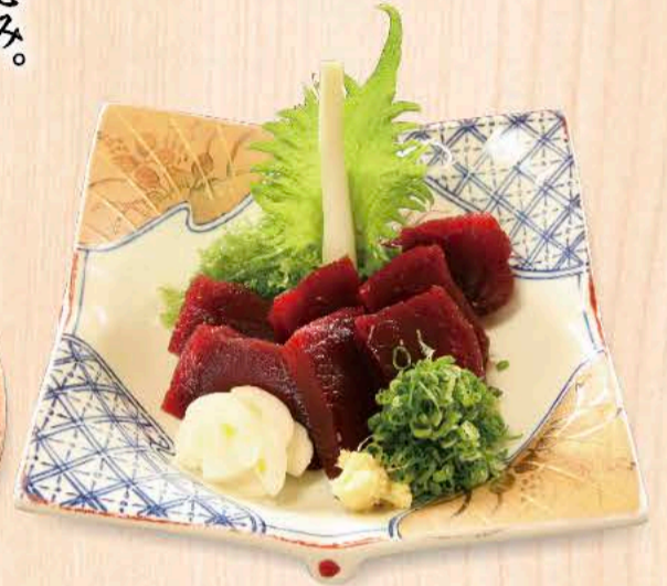
鯨の刺身 2,200円 臭みはなく赤身のうまみをかみしめて下さい