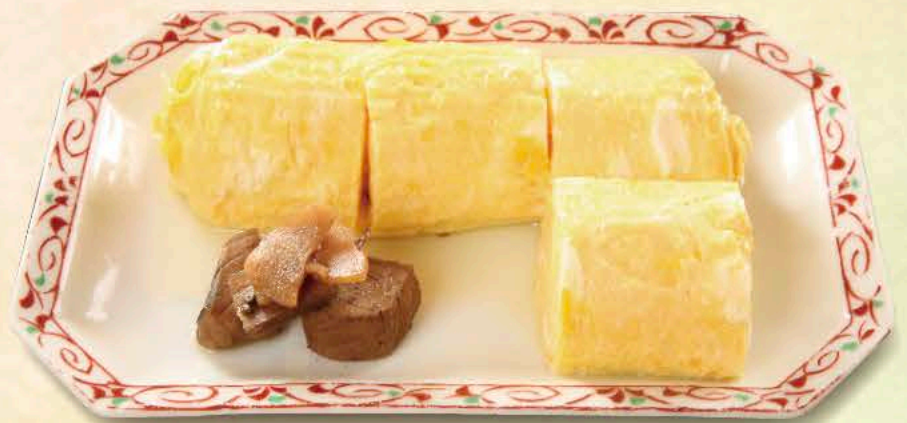
だしまき玉子 660円 おだしたっぷり 熱々をハフハフとどうぞ