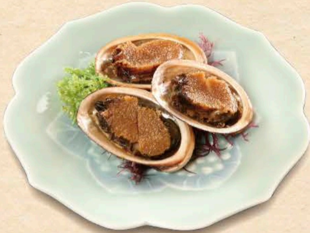
とこぶしの甘煮 880円