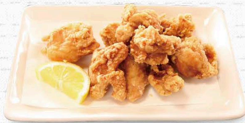
若鶏のから揚げ 1,100円