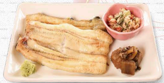
鰻の白焼き 2,970円 ふっくら蒸されて、ワサビ醤油でどうぞ