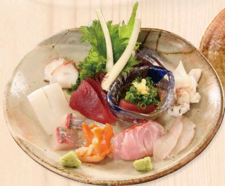
刺身の盛り合わせ (二人前) 3,300円～