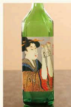
おんな泣かせ 大吟醸 1,650円