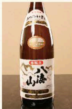
八海山 本醸造 (新潟) 990円