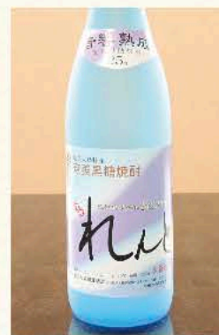
れんと[黒糖] (鹿児島) 25度 720ml 3,850円