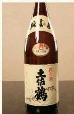
土佐鶴 純米 (高知) 770円