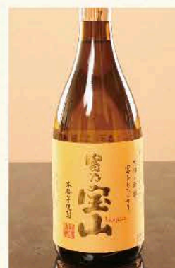
富乃 宝山[芋] (鹿児島) 25度 720ml 3,850円