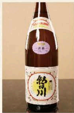
朝日川 (山形) 二合 880円