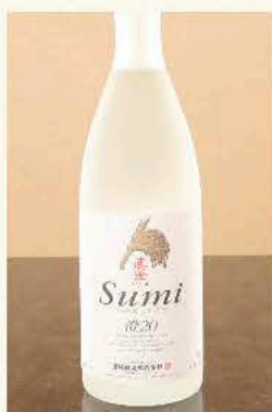
澄[米] (長野) 20度 720ml 3,850円