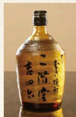
吉四六[麦] (大分) 25度 720ml 4,400円