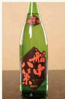
船中八策 純米 (高知) 770円