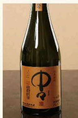
中々[麦] (宮崎) 25度 720ml 3,850円