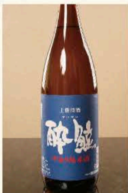
酔鯨中取り純米 (高知) 880円