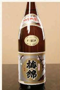
梅錦 吟醸 (愛媛) 770円