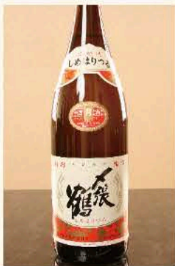
八張鶴 本醸造 (新潟) 990円