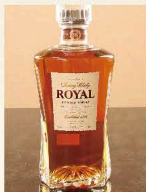
ウイスキーロイヤル 〈ボトル〉 7,700円