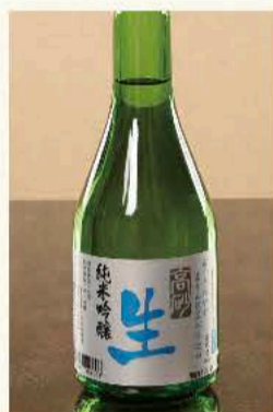
高砂純米 吟醸生酒 300ml(静岡) 1,320円