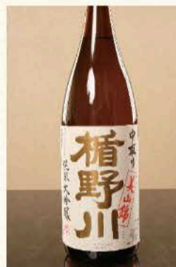
楯野川 純米吟醸 (山形) 880円