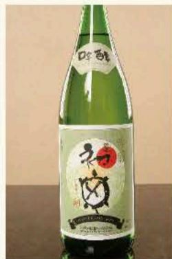
初亀 吟醸 (静岡) 880円