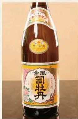
司牡丹 (高知) 二合 1,100円