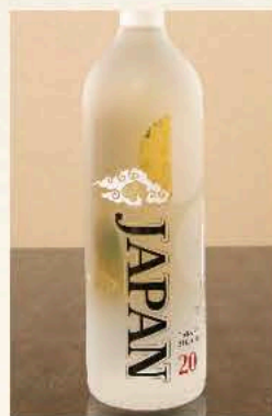
JAPAN[甲類] 20度 720ml 2,750円