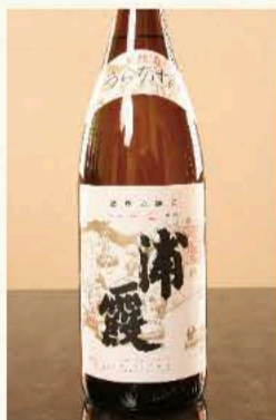
浦霞 本醸造 (宮城) 770円