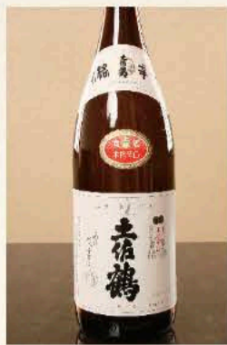
土佐鶴 本格辛口 (高知) 二合 1,100円