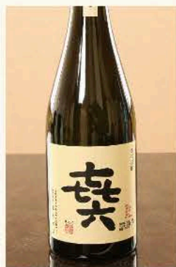
森六[芋] (宮崎) 25度 720ml 3,850円