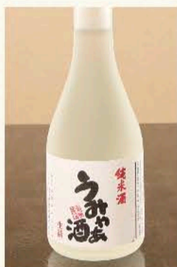
うみやあ酒 純米生詰 300ml(静岡) 1,320円