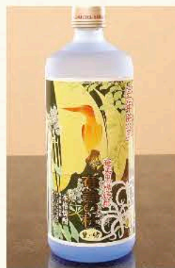
奄美の杜[黒糖] (鹿児島) 25度 720ml 3,850円