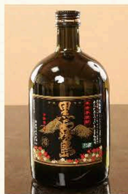
黒霧島上[芋] (宮崎) 25度 720ml 3,850円