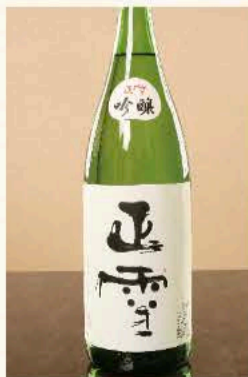
正雪 吟醸 (静岡) 1,100円