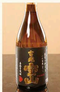
吉兆 宝山[芋] (鹿児島) 25度 720ml 3,850円