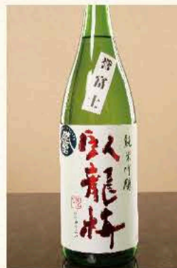
臥龍梅 純米吟醸 (静岡) 880円