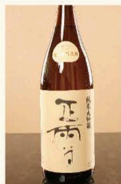
正雪 大吟醸 1,650円