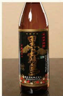
黒霧島[芋] (宮崎) 25度 900ml 3,300円