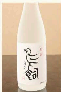
烏飼[米] (熊本) 25度 720ml 3,850円